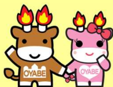
小矢部市シンボルキャラクター メルギューくん・メルモモちゃん

人口: 29,577人 世帯数: 10,547世帯 面積: 134.07Km 2 学校等: 保育所2、幼保連携型認定こども園6、小学校5、中学校4 医療: 医療機関16 歯科医院: 11